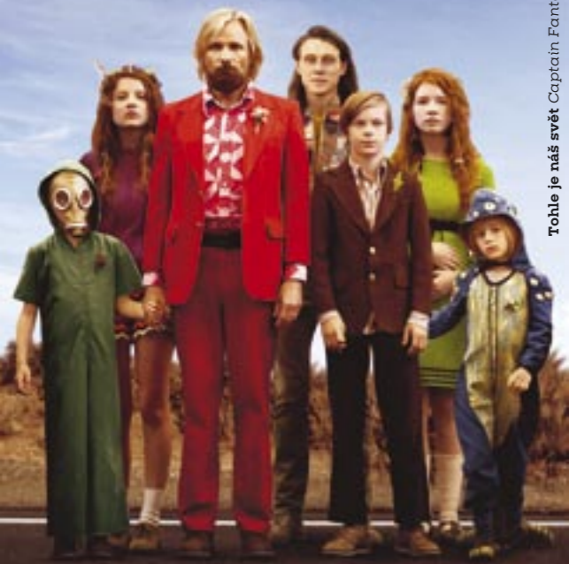
Tohle je náš svět Captain Fantastic Matt Ross