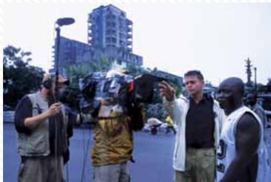
LiE 2 Dr. Brasher s filmovým štábem v Libérii / Dr. Brasher with film crew in Liberia.